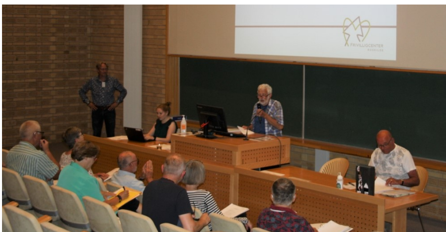
Rådhusets auditorium - med god plads både på scenen og i salen.