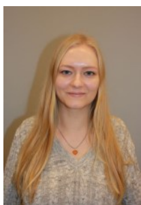
Marie Sociale medier