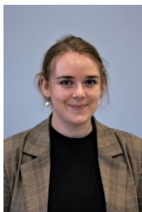
Ida Sociale medier