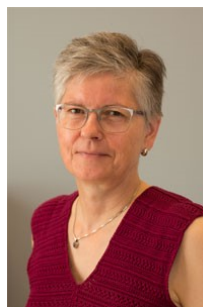
Lone Ingemann Kommunikation Webmaster