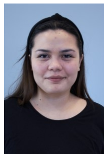
Dina Sociale medier